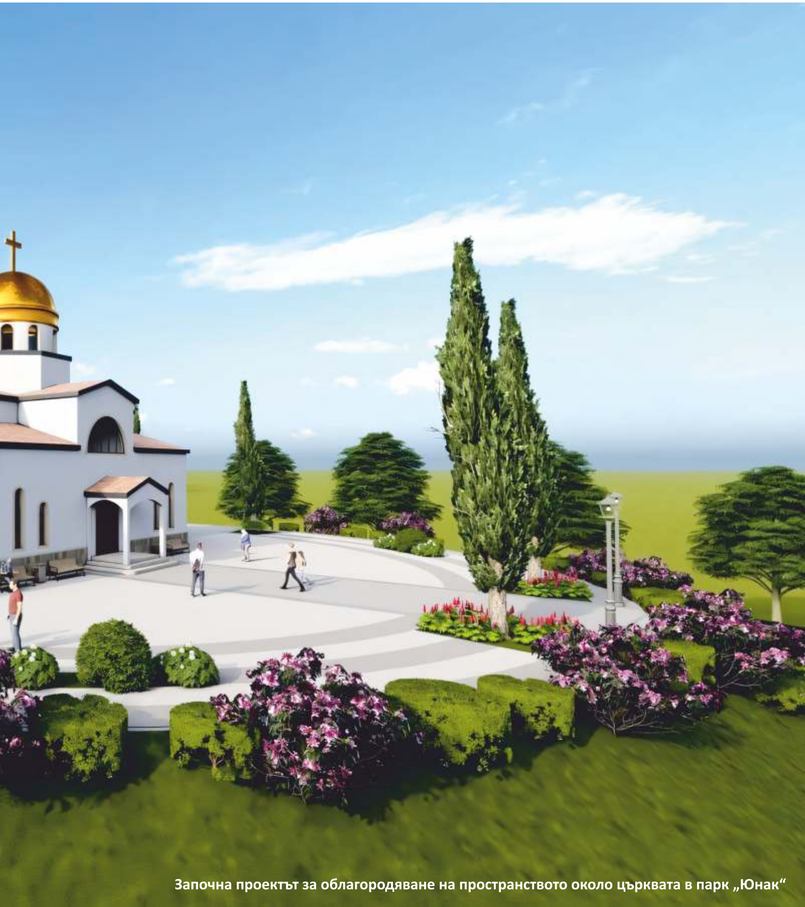
Започна проектът за облагородяване на пространството около църквата в парк „Юнак“